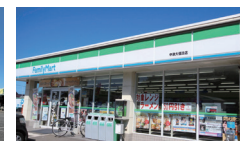
ファミマ中津大悟法店 570m